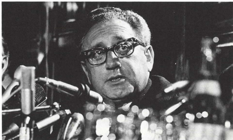
Henry Kissinger (f. 1923), amerikansk politolog, USA's udenrigsminister under Nixon og Ford, fotograferet kort efter, at han havde modtaget Nobel-fredsprisen.

sprogforsker og new left ideolog Noam Chomsky i 1969 rettede på „de nye mandariner“. 38 Det forhindrede ikke Richard Nixon i at udnævne politologen Henry Kissinger til udenrigsminister eller Jimmy Carter i at gøre de to Columbia-professorer Zbigniew Brzezinski og Marshall Shulman til sine udenrigspolitiske rådgivere.