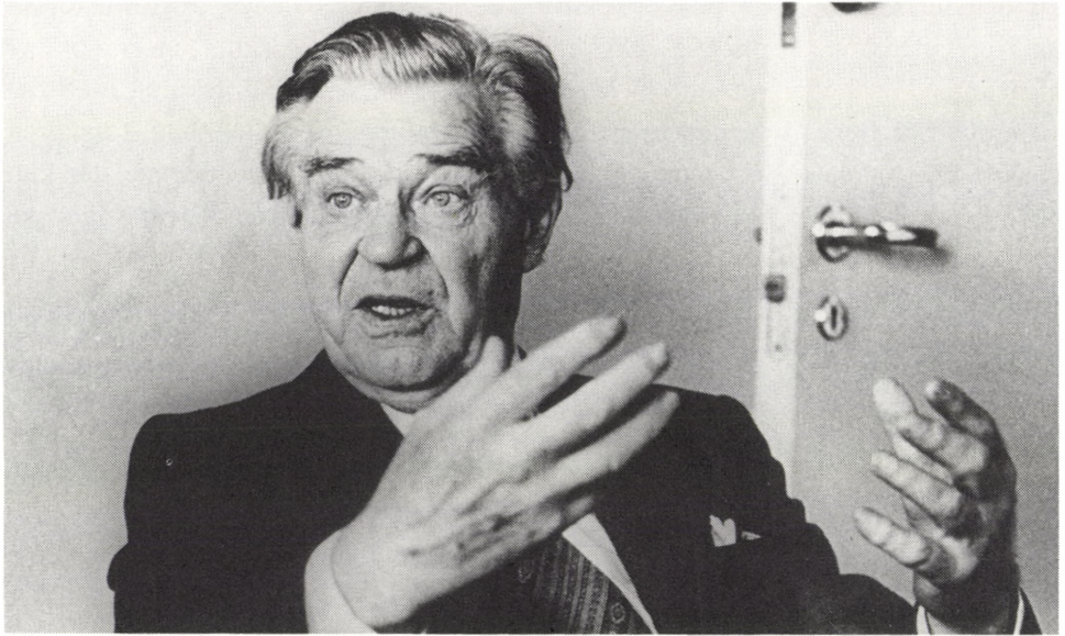
Gunnar Myrdal (f. 1898), svensk nationaløkonom og politiker, fotograferet kort efter, at han sammen med A. F. von Hayek havde modtaget Nobel-prisen i økonomi.

være inde på, at problemet er klaret ved, at man „ekspliterer sine værdier“, som det hedder, hvormed nærmest menes udtrykkeligt siger, hvor man står politisk. Dog er Myrdal ikke ganske konsekvent, idet han samtidig skriver, at „forskere inom det samhällsvetenskapliga området har så genomgående insupit den sanningssökande andan, att man allmänt märker att de blir speciellt glada när de kommer fram till slutsatser, som skiljer sig från vad de från början hade antagit“. 51 Han synes altså at mene, at der eksisterer en særligt „sanningssökande anda“, uafhængigt af værdierne. Det karakteristiske ved den er, at forskeren bliver særligt glad ved at komme frem til resultater, der strider mod hans forhåndsantagelser. Herved skulle forskerholdningen adskille sig diametralt fra den almindelige perceptionstendens, som man har kaldt „dissonansdøvhed“, d.v.s. tilbøjeligheden til at overse og overhøre ting, der ikke stemmer med ens forudindtagne meninger. 52 I en sådan opfattelse er Myrdal på linie med Karl Popper, der understreger, at den egentlige videnskabelige forskningsproces består i at søge at gendrive teorier, og fremhæver, at en teori ikke kan anses for underbygget (bewährt), fordi man finder bekræftende data, men kun når man ikke kan